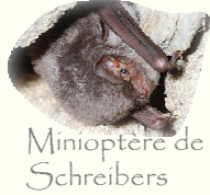
Minioptère de Schreibers

☑ Contrôle sur place que les pratiquants et les encadrants ont été informés des enjeux biologiques du site et des bonnes pratiques environnementales à appliquer dans le cadre de cette activité (documents d'information, introduction orale aux départs en activités organisées, utilisation de l'exposition mise à disposition par l'opérateur Natura 2000...)