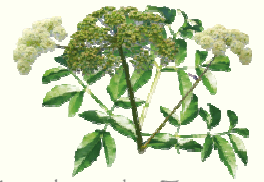
Angélique des Estuaires