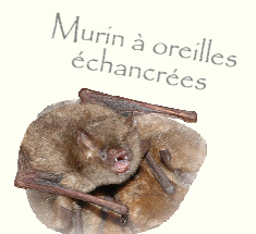
Murin à oreilles échancrées