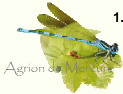
Agrion de Meunier

Une communication sur le site Natura 2000 et sur la charte permet d'informer les utilisateurs de l'implication de la structure de canoë – kayak dans le réseau Natura 2000 et de les sensibiliser.