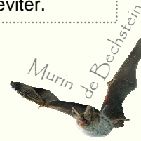
Murin de Bechstein