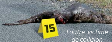
Loutre victime de collision