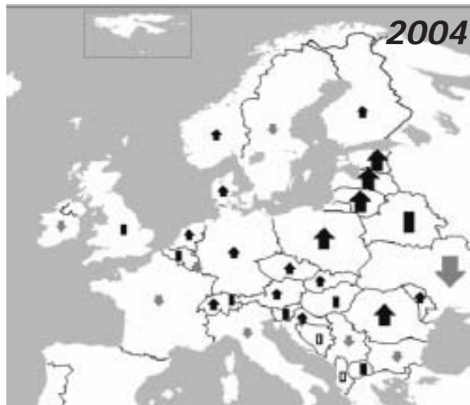
Extrait de : BIRDLIFE INTERNATIONAL. 2004. Birds in Europe: population estimates, trends and conservation status. BirdLife International, Conservation Series No. 12. Cambridge, UK.