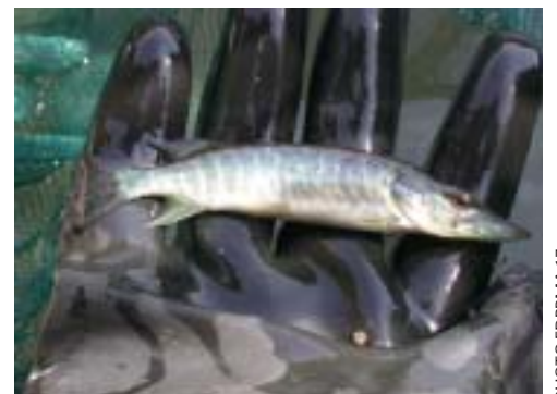
Un jeune brochet sur la frayère de St Sorlin.