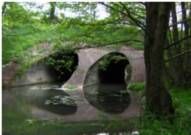
Ci-dessus : Ouvrage à risque : le vison ne peut pas continuer sur la berge. Comme il ne nage pas, il va donc remonter et traverser la chaussée, ici une autoroute (A10, Bramerit).

Les contacts avec les partenaires de l'aménagement et de l'entretien des routes sont positifs : DID-Conseil général pour les départementales, DIRA / routes nationales, ASF / autoroutes. Des accords de principe sont trouvés sur les