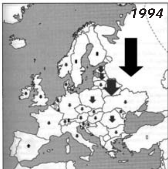
Extrait de : BIRDLIFE INTERNATIONAL. 1994. Birds in Europe: population estimates, trends and conservation status. BirdLife International, Conservation Series No. 12. Cambridge, UK.

Bernard Deceuninck & Emmanuelle Champion, LPO.