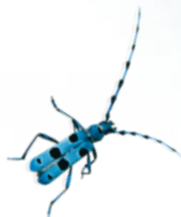
Rosalie des Alpes