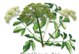
Angélique des estuaires

Consultez le site internet pc70valcharente.n2000.fr