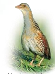
Râle des genêts